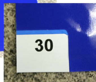
「フィルムめくりタブ」