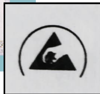
「ESD静電気対策マーク」