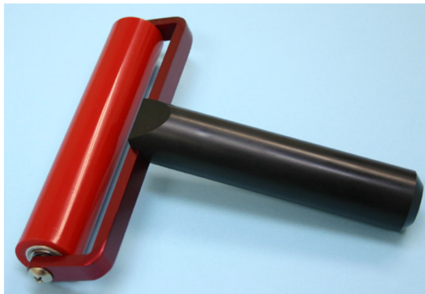
本体アーム・・・アルミ製 持ち手・・・導電性樹脂製