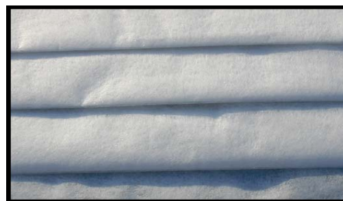
「ケミカルフリー 三層フィルター」