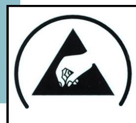
「ESD静電気対策マーク」