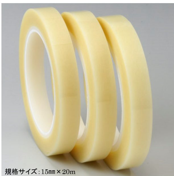
規格サイズ: 15mm × 20m