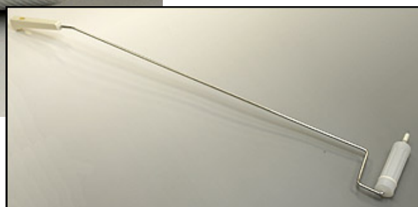
(専用ハンドル / 床面用ロングタイプ)