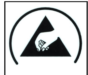
ESDラベルが付属します