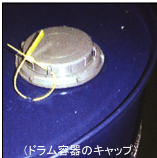
(ドラム容器のキャップ)